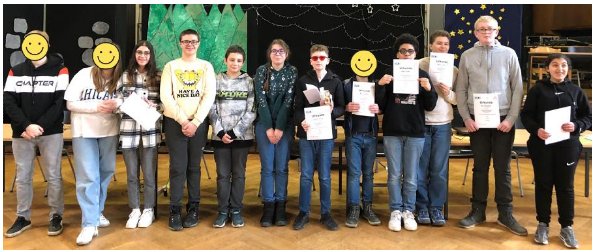
Bildbeschreibung 4: Gruppenfoto mit den Teilnehmenden, die ihre Urkunden hochhalten

Nach einer kurzen Pause an der frischen Luft bereiteten sich die Teilnehmer*innen auf den unbekanntem Text vor. Zunächst lasen wieder die Schüler*innen der Klassen 5-6 ihre jetzt unbekanntem Ausschnitte vor, anschließend lasen die Schüler*innen der Klassen 7-10. Dieses Jahr hatte sich das Organisationsteam für das Buch „Hände weg von Mississippi“ von Cornelia Funke entschieden. Nach einer kurzen Beratungspause der Jury konnten gegen 12.30 Uhr die offiziellen Ergebnisse mitgeteilt und die Sieger*innen geehrt werden.