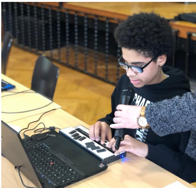
Bildbeschreibung 2: Schüler liest an der Braillezeile