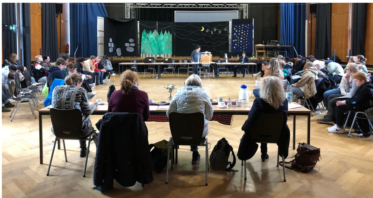
Bildbeschreibung 1: Aula mit Leser*in, Zuhörenden und vierköpfiger Jury

Dank der Unterstützung von Kiwanis – Division Rhein-Eifel, erhielten alle Sieger*innen und Teilnehmer*innen Preise und Urkunden.